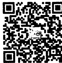
ขั้นตอนการลงทะเบียน