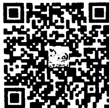
กำหนดการ