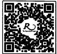
QR CODE สำหรับจองห้องพัก มหาวิทยาลัยศิลปากร

การสำรองห้องพัก ท่านสามารถจองห้องพักกับทางโรงแรมโดยสแกน QR-Code สำหรับจองห้องพัก หากท่านจองห้องพักหลังห้องพักอาจเต็มได้ และอาจจะไม่ได้ห้องพักราคาพิเศษ โรงแรมรอยัลริเวอร์ ๒๑๙ ซอยจรัญสนิทวงศ์ ๖๖/๑ แขวงบางพลัด เขตบางพลัด กรุงเทพฯ ๑๐๗๐๐ โทรศัพท์: ๐๒-๔๒๒-๙๒๒๒ โทรสาร : ๐๒-๔๓๓-๕๘๘๐ E-mail : rsvn@royalriverhotel.com