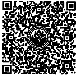
QR-Code เพื่อสมัครอบรม

ติดต่อคุณแปง มือถือ/ ID Line: ๐๙๙๔๔๖๙๒๖๖ โทรศัพท์๐๒ ๑๐๕๔๖๘๖ ต่อ ๑๐๐๒๖๖ ติดต่อคุณแอน มือถือ / ID Line: ๐๙๐๘๘๖๗๓๗๒ สามารถส่งใบสมัครอบรมแบบออนไลน์และ ดาวน์โหลดรายละเอียดได้ที่ Website: www.thailocalsu.com